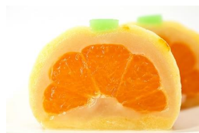
みっちゃん大福プレミアム