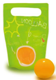
風船みかんゼリー