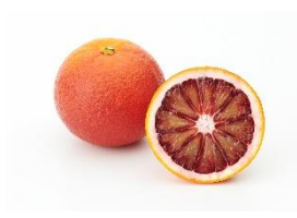
ブラッドオレンジ