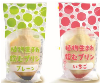
植物生まれ飲むプリン