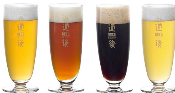
道後ビール(ケルシュ・アルト・スタウト・ヴァイツェン)